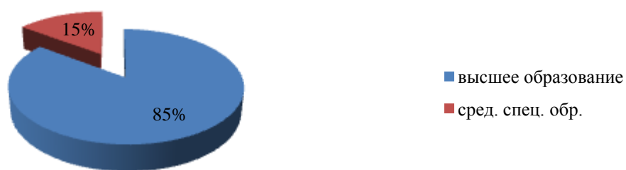
«Образование педагогического коллектива»